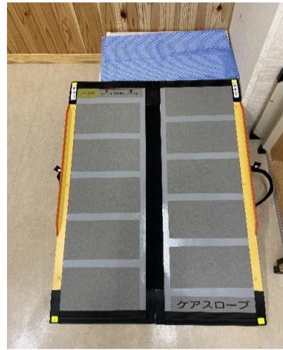
9. 可搬式スロープ CS-100