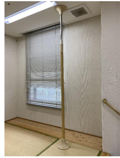
3. ベスポジ基本セット BPE-100-11