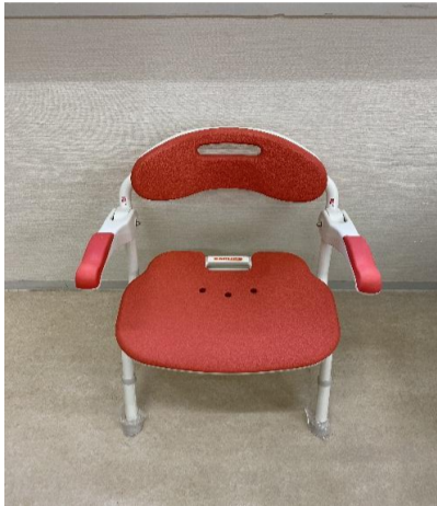
4. シャワーベンチ FS536-050