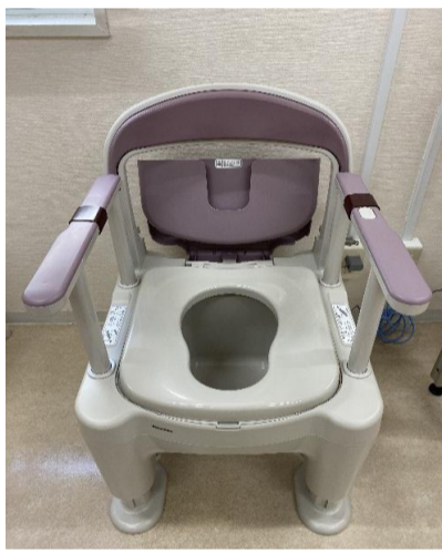
8. 座楽ラフィーネ ポータブルトイレ PN-30201V