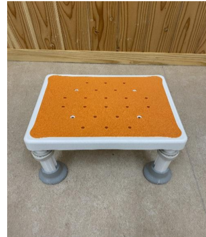
6. 浴槽台 PN-L11726D