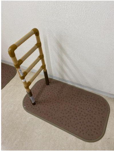
1. たちあっぷ CKA-12