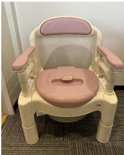
7. 安寿ポータブルトイレ FX-CF