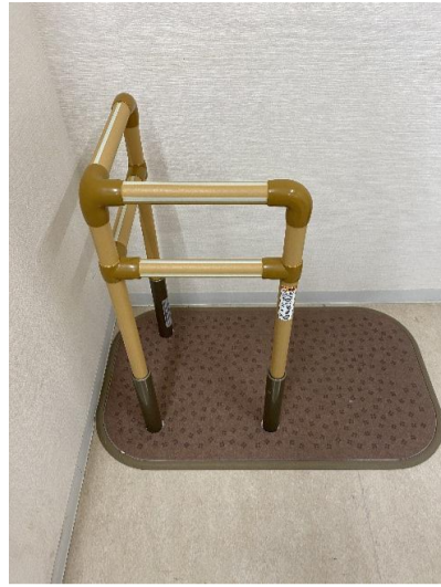
2. たちあっぷ CKA-13