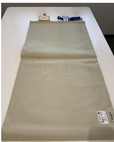
13. センサーマット HKSM-3A