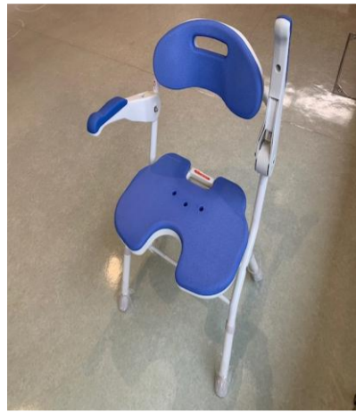
5. シャワーベンチ FU536-054