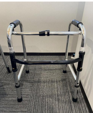
11. アルミ歩行器 HKM-100